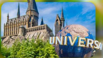
เลือกอิสระ Universal Studios Japan